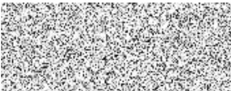
----- ověřovatel zápisu