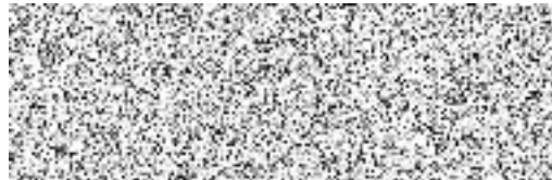
----- ověřovatel zápisu