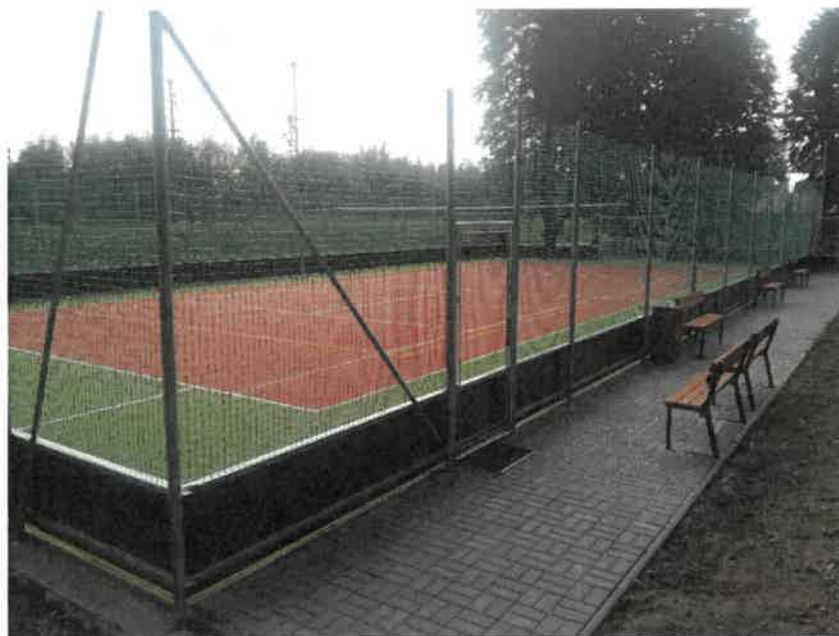
Obr. 1 Víceúčelové hřiště na Sokolce, 2016

Víceúčelové hřiště na výletišti sokolka a dětská hřiště u mateřské školy a na výletišti sokolka.